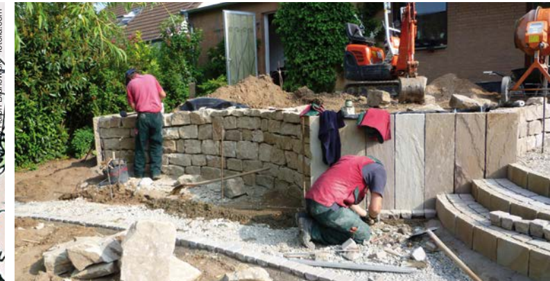
KOMBINATION VON BEISPIEL 1 UND BEISPIEL 2: